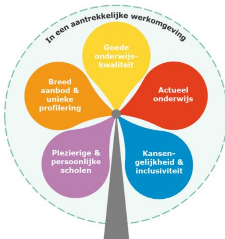
Visualisering strategienota LMC