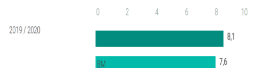
5. De ontwikkeling van de resultaten en de benchmark

Afgelopen periode zijn de oudertevredenheidsonderzoeken afgenomen. Het eindcijfer staat op een 8,1 en daar zijn we natuurlijk hartstikke trots op. Tegelijkertijd nemen we de aandachtspunten mee naar de toekomst en zien we dit cijfer als een mooi meetmoment om verder te bouwen. De aankomende periode volgt er nog een tevredenheidsonderzoek voor de leerlingen en nog een voor de ouders. Dit keer gaat het over het geven van onderwijs op afstand en hoe u dat ervaren heeft. Dit was voor iedereen een nieuwe ervaring; lessen op afstand middels Teams en magister. Graag horen we van u hoe u dit ervaren heeft en nemen we ook die aandachtspunten en complimentjes mee naar het team!