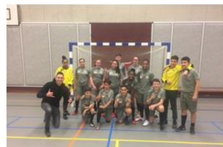
Challenge 010 voetbal